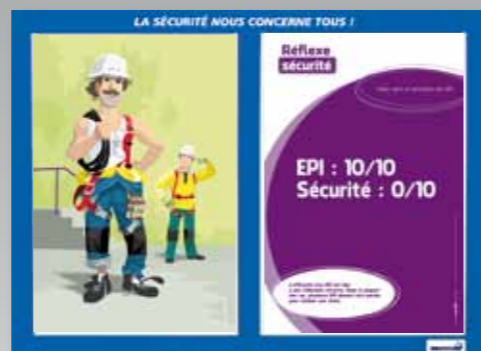
3. Choix, port et entretien des EPI