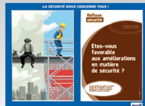
12. Amélioration continue en matière de sécurité