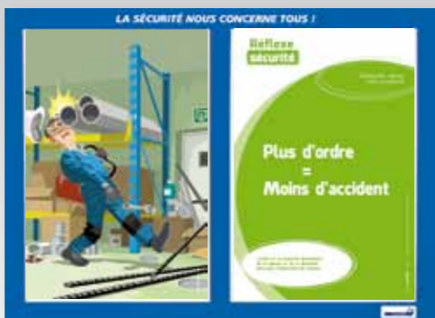
5. Organisation, rigueur, ordre et propreté