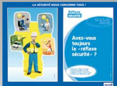
1. Réflexe sécurité, réfléchir avant d'agir, observation, analyse de risque de dernière minute