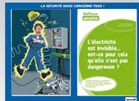
11. Risque électrique, respect des procédures