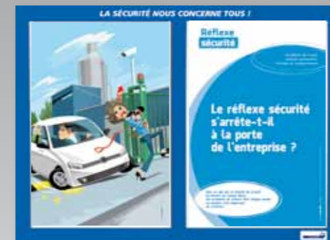
7. Accidents de trajet, conduite préventive, attitude et comportement