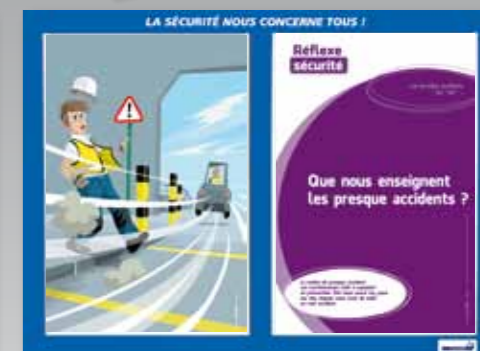
9. Les presque accidents, les « ouf »...