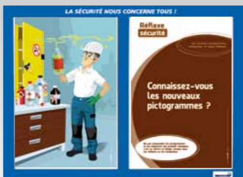
6. Les nouveaux pictogrammes, l'étiquetage, le risque chimique