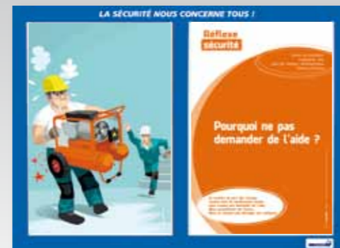
10. Excès de confiance, ergonomie, dos, port de charges, manutentions, bonnes postures