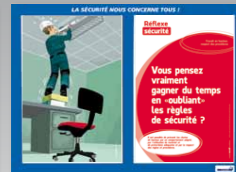
8. Travail en hauteur, respect des procédures