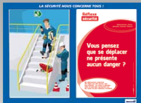
2. Déplacements, chutes, glissades, entorses, foulures