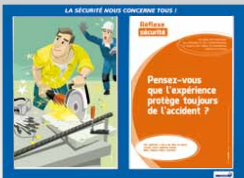
4. Le poids des habitudes, les attitudes et les comportements, le respect des règles et procédures, vigilance partagée